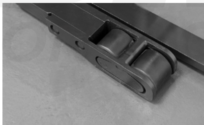
Cajas de ruedas de carga atornilladas

Mantenimiento fácil y rápido (protector de dedos opcional)