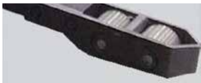
Toe Guard (opcional)